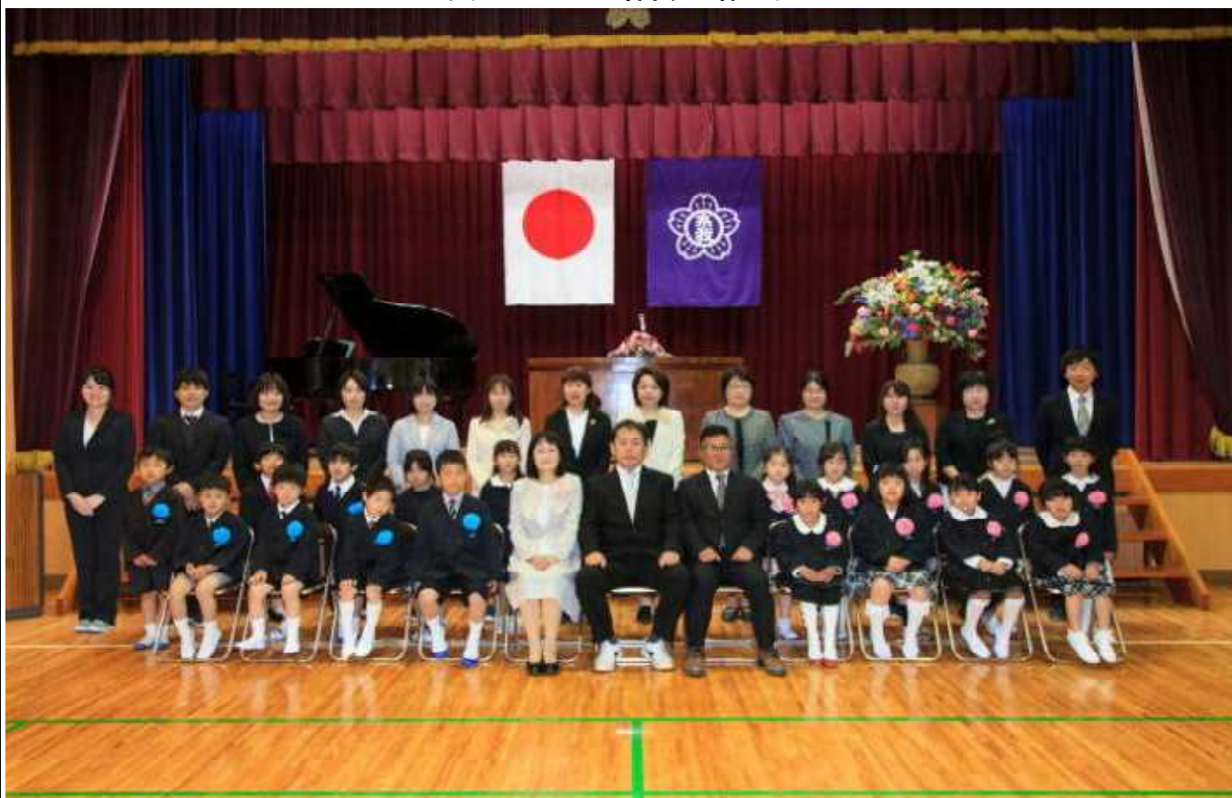
(4・10 入学式の1年生児童と教職員集合写真です)